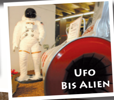
UFO BIS ALIEN