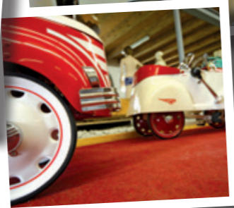
SOLYTO MILITÄR- GESPANN