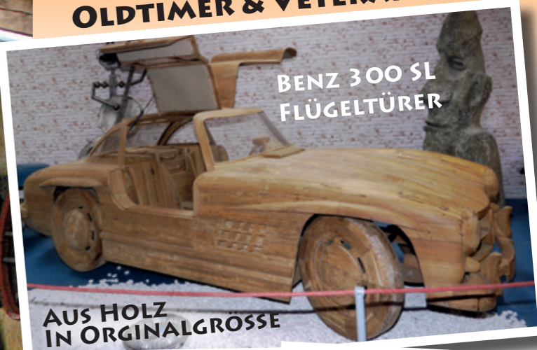
BENZ 300 SL FLÜGELTÜRER

AUF 2 500 QM CURIOSSES OLDTIMER & VETERANEN