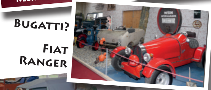
BUGATTI? FIAT RANGER