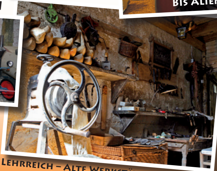
LEHRREICH - ALTE WERKSTÄTTEN