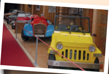
SKURRILE KLEINFahrZEUG- SAMMLUNG

EIN DUTZEND NUSCHELNDE DUZER DUZEN NUSCHELND DUTZENDE DUZENDER NUSCHLER NUSCHELND