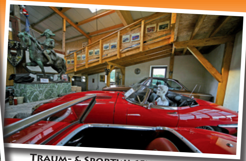
TRAUM- & SPORTWAGEN